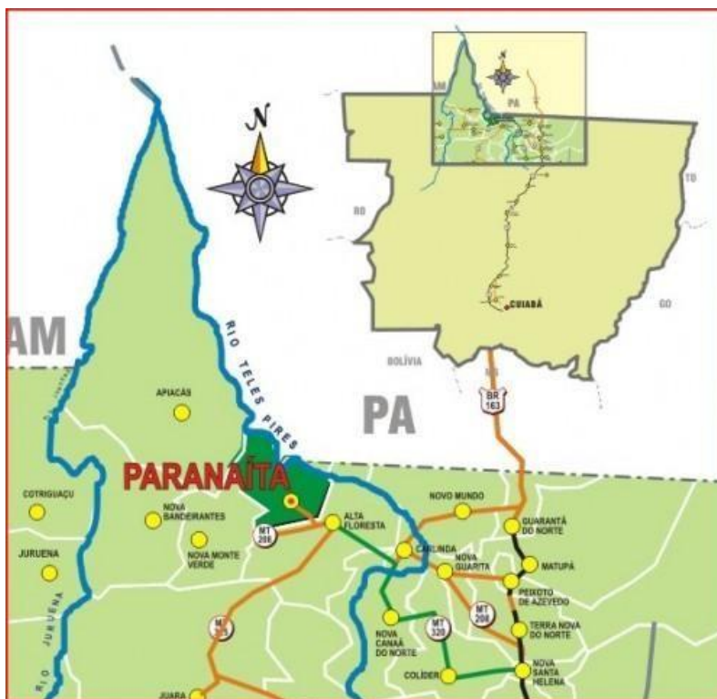
Mapa de Paranaíta – MT.

Estado/Região: Mato Grosso/Região do Alto Tapajós.