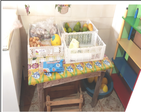
Foto 19 – (Cozinha da Creche Criança Feliz – Jardim Esperança). Alimentos que precisam de refrigeração estão fora da geladeira e no chão, onde facilita a contaminação dos alimentos o seu apodrecimento antecipado em especial pelo calor excessivo no local inspecionado. Resolução RDC 216 de 15/09/2004, Item 2.13 que trata de conservação de alimentos perecíveis. Paranaíta/MT, 29/09/2016.