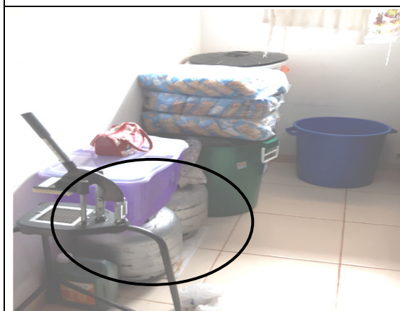
Foto 07 – (Dispensa da Escola Cristo Redentor) - Botijão reserva em local impróprio (sem abrigo na parte exterior da edificação – NBR/ABNT 13523), Paranaíta/MT, 28/09/2016.