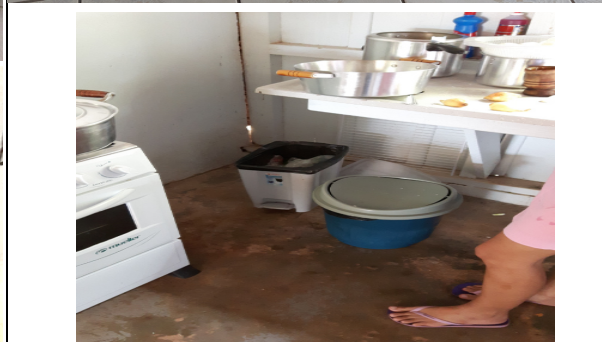
Foto 12 – ( Foto Superior – Cozinha da Escola Juscelino K. de Oliveira. Foto Inferior na cozinha da Escola Getulio Vargas A “Com. Mandacaru”) Detalhe do piso da cozinha escolar (item 4.1.3 da Resolução-RDC Anvisa 216/2004), Paranaíta/MT, 30/09/2016.