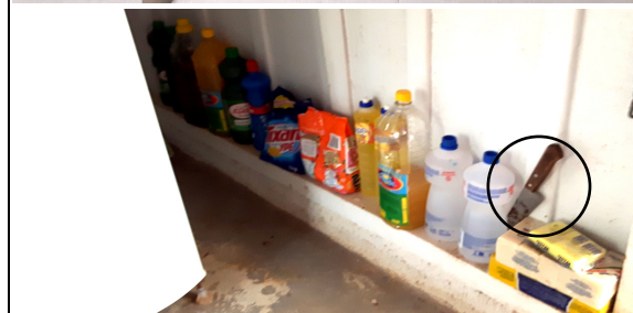
Foto 11 – ( Foto Superior dispensa da Escola Maria Quitéria - Melão e Cebola no chão próximo a baldes, panos de limpeza e água sanitária. Foto Inferior na cozinha da Escola Getulio Vargas A “Com. Mandacaru” Produtos de Limpeza na cozinha ao lado da geladeira “Sabão barra e em pó, álcool, detergente, água sanitária. Detalhe para a faca exposta ). Armazenamento inadequado de gêneros alimentícios com produtos de limpeza no mesmo local, Paranaíta/MT, FNDE, 28/09/2016.