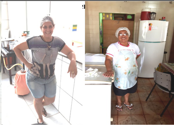
Foto 10 – (Cozinha da Escola Tancredo A. Neves e cozinha da Creche II-Jd Esperança a direita) Merendeiras sem uniforme (Item 4.6.3 da Resolução-RDC Anvisa 216/2004); não realizaram exames médicos pelo menos uma vez ao ano (Item 4.6.1); sem capacitação em segurança dos alimentos (Item 4.6.7) e 1 (uma) merendeira (Esquerda na foto) com adorno (brincos) (item 4.6.6), Paranaíta/MT, 28 e 29/09/2016.