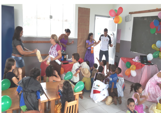
Foto 21 – (Festa a Fantasia na Sala de Aula – Escola Tancredo de Almeida Neves). Oferta de Alimentos de baixo valor nutricional e proibidos levados pelos alunos e pelos Pais presentes na festa. Foram ofertados Refrigerantes, Pão de mel, bolos de chocolate, paçoca, amendoim salgado pronto etc... “Neste dia os alunos desta sala não comeram a merenda escolar oferecida na escola”, somente os alimentos da festa”. Art. 22 e 23 da Resolução 26/2013 FNDE PNAE. Paranaíta/MT, 28/09/2016.