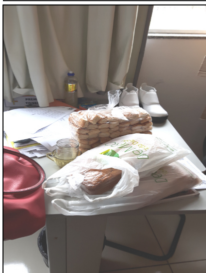
Foto 03 – Mesa da Sala da Nutricionista e Merenda Escolar. Bolachas, Botina, desinfetante sobre a mesa. Falta Depósito Central para armazenamento e distribuição de alimentos. Paranaíta/MT, 06/10/2016.