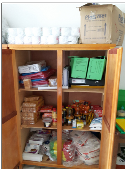
Foto 01 – Armário com alimentos na Sala da Nutricionista e Merenda Escolar. Demonstra a necessidade de um Depósito Central. Paranaíta/MT, 27/09/2016.

O município deverá possuir estrutura necessária e adequada para realizar o controle de estoque e o armazenamento dos gêneros alimentícios.