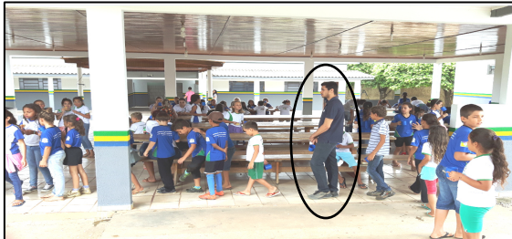
Foto 23 – (Foto Superior - Escola Getúlio Vargas A - Gleba Mandacarú, tirada em 27/09/2016). Professora e merendeira almoçando da merenda escolar junto aos alunos.

Foto Inferior – Escola Juscelino K. de Oliveira. Servidor na fila da merenda, foto tirada em 28/09/2016. Resolução 26/2013 - PNAE, Art. 3º. Paranaíta/MT, 28/09/2016.