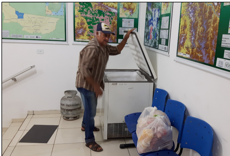
Foto 02 – Recepção Secretaria de Educação – Produtor Entregando Polpas de frutas. Um Freezer na Recepção demonstra a necessidade adequar recursos para criação de um Depósito Central. Paranaíta-MT, 27-09-2016.