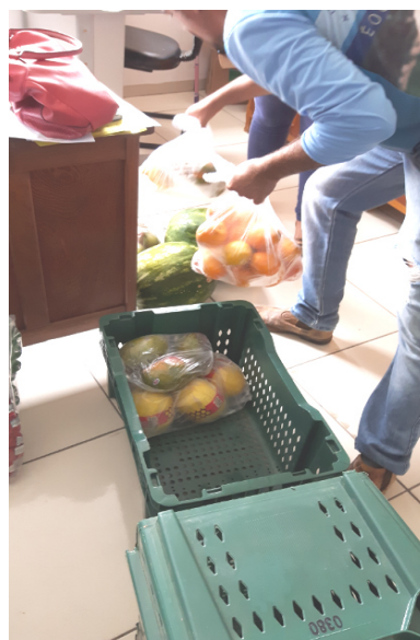
Foto 04 – Funcionário do Mercado entregando alimentos perecíveis na Sala da Nutricionista e Merenda Escolar. Possui Necessidade de um Depósito Central para Armazenamento e distribuição. Paranaíta/MT, 06/10/2016.

Nesse sentido, a Resolução-RDC Anvisa nº 216/2004 apresenta diversas Boas Práticas para serviços de alimentação a fim de garantir as condições higiênico-sanitárias do alimento preparado.