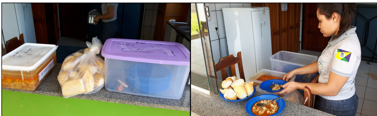
Foto 23 – Merenda preparada na Escola Juscelino K. de Oliveira e transportada todos os dias para a Escola Nossa Senhora das Graças e servida inadequadamente para uma única sala com 13 alunos do infantil. A escola N. S. das Graças possui estrutura que comporta a formulação de alimentos, possui geladeira e fogão adequados, basta adequar o quadro de pessoal de merendeiras ou remanejar a sala para outra escola devidamente adequada. Paranaíta, 03/10/2016.

Sabendo que na escola Nossa Senhora das Graças estudam apenas uma sala com 13 alunos do infantil regular, e que é próxima da cidade, esta UCI recomenda transferir os alunos para escolas onde possui estrutura para oferecer a merenda adequadamente, ou recomenda contratar/convocar Merendeira para atuar na escola, conforme determina a legislação vigente.