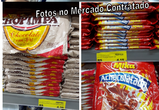
Foto 13 – (Escola Maria Quitéria) – Foto Superior tirada na dispensa da Escola em 28/09/2016. A Foto inferior foi no Mercado Contratado em 11/10/2016. Produtos entregues diferentes do Contrato 010/2016: Achocolatado com descrição no contrato somente Marca Chopimpa 400g, e foi entregue Marca Mika 300g. Não houve conferência de quantidades e Marcas e constatou-se que embora o Mercado Contratado tenha vencido o item à R$ 3,40 o valor unitário, é obrigado a entregar o que possui maior quantidade conforme o contrato 010/2016. Não houve conferência na entrega dos itens. Paranaíta/MT, 28/09/2016.