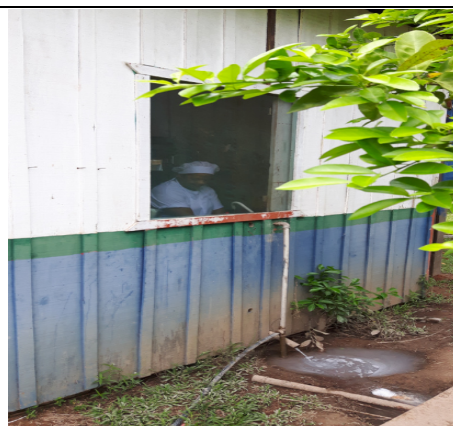
Foto 16 – (Cozinha - foto externa da Escola Getúlio Vargas B) – Jacareacanga-PA - Termo de Cooperação 001/2015. Encanamento da Pia da Cozinha a céu aberto, sem condições de higiene. Resolução RDC 216 de 15/09/2004, item 4.1.6. Trata da limpeza de caixas de gordura periodicamente. Paranaíta-MT, 27/09/2016.