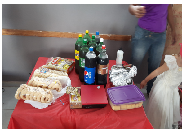
Foto 22 – (Festa a Fantasia na Sala de Aula – Escola Tancredo de Almeida Neves). Mesmo evento referente a foto 17. Oferta de alimentos de baixo valor nutricional proibidos sem o devido controle de porções e modo de preparo pela Nutricionista responsável. Art. 22 e 23 da Resolução 26/2013 FNDE PNAE. Paranaíta/MT, 28/09/2016.