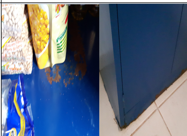
Foto 08 – (Dispensa da Escola Tancredo A. Neves) Produtos dispostos em prateleiras em mal estado de conservação e enferrujada (item 4.7.6 da Resolução-RDC Anvisa 216/2004), Paranaíta/MT, 28/09/2016.