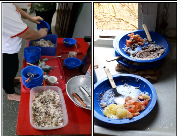
Foto 20 – (Refeitório da Creche Criança Feliz I – Centro), Falta preparações em porções e FTP. É obrigatória a preparação de alimentos a partir da ficha técnica de preparo FTP e mensurar as porções por aluno para não haver desperdício. Art. 14, Seção II, VI, § 4º que diz que as porções devem ser ofertadas conforme a faixa etária do aluno. § 7º trata da ficha técnica de preparo. Ainda falta ser feito o teste Escala Hedônica ou Resto ingestão “feito somente em uma escola - JK” Art. 17 §4, 5 e 6. Paranaíta/MT, 29/09/2016.