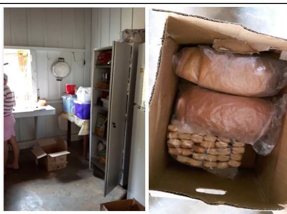
Foto 18 – (Cozinha da Escola Getúlio Vargas A) – Gleba Mandacarú. Itens da Merenda acondicionados em caixas de papelão no chão, mostrando falta de higiene no armazenamento dos alimentos. Paranaíta-MT, 27/09/2016.

Na foto, no refrigerador da geladeira pode-se ver os Refrescos que são vendidos na escola, conhecidos também como “geladinhos”. A comercialização desses alimentos não foi autorizada pela Nutricionista. Paranaíta/MT, 27/09/2016.