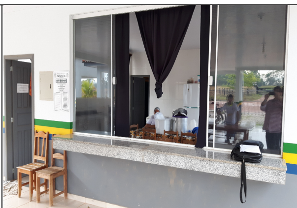
Foto 06 (Janela da Cozinha da Escola São Pedro) – Janela aberta, sem tela milimétrica de proteção (item 4.1.4 da Resolução-RDC Anvisa 216/2004), possibilitando entrada de poeira, insetos e roedores. Paranaíta/MT, 28/09/2016.