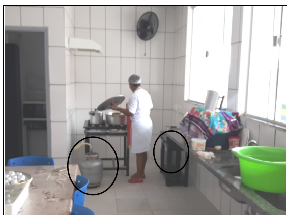
Foto 05 (Cozinha da Escola Maria Quitéria) – Botijão de gás na cozinha “Dois” (sem abrigo na parte exterior da edificação – NBR/ABNT 13523), Paranaíta-MT, 28/09/2016.

Foi constatado que as Escolas não possuem estrutura para o adequado armazenamento e preparo dos gêneros alimentícios utilizados na merenda escolar, conforme apresentado a seguir: