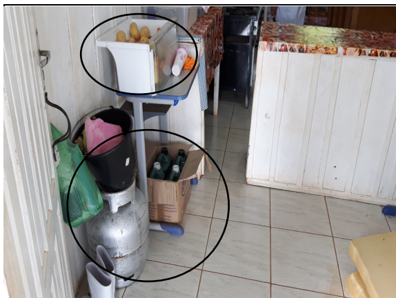
Foto 15 – (Cozinha da Escola Getúlio Vargas B) – Jacareacanga-PA - Termo de Cooperação 001/2015. Armazenamento inadequado de gêneros alimentícios com produtos de limpeza no mesmo local (FNDE, 2014), Paranaíta/MT, 28/09/2016. Botijão reserva em local impróprio (sem abrigo na parte exterior da edificação – NBR/ABNT 13523), Paranaíta/MT, 27/09/2016.