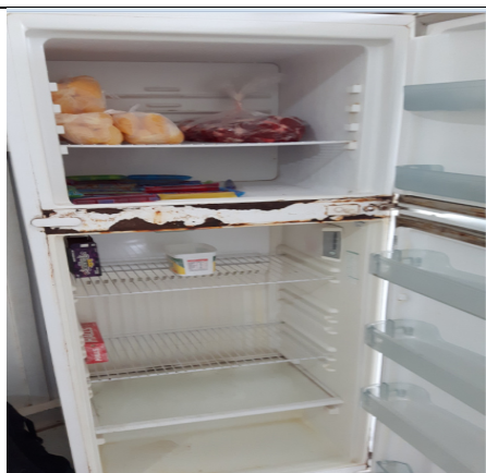
Foto 17 – (Cozinha da Escola Getúlio Vargas B) – Jacareacanga-PA - Termo de Cooperação 001/2015. Geladeira em péssimas condições de uso. Não possui energia no período noturno, o que dificulta a conservação de alimentos que precisam de refrigeração. É preciso que os Governantes providenciem rede de energia elétrica ou um sistema que de gerador que funcione a noite.

Na foto, no refrigerador da geladeira pode-se ver os Refrescos que são vendidos na escola, conhecidos também como “geladinhos”. A comercialização desses alimentos não foi autorizada pela Nutricionista. Paranaíta/MT, 27/09/2016.