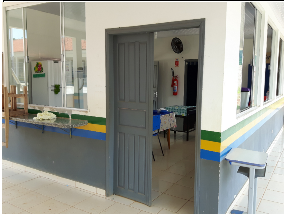
Foto 09 – (Porta de entrada da cozinha, Escola Cristo Redentor) Porta da cozinha sem proteção nas aberturas inferiores para impedir a entrada de insetos e roedores e sem fechamento automático (item 4.1.4 da Resolução-RDC Anvisa 216/2004). Paranaíta/MT, 28/09/2016.