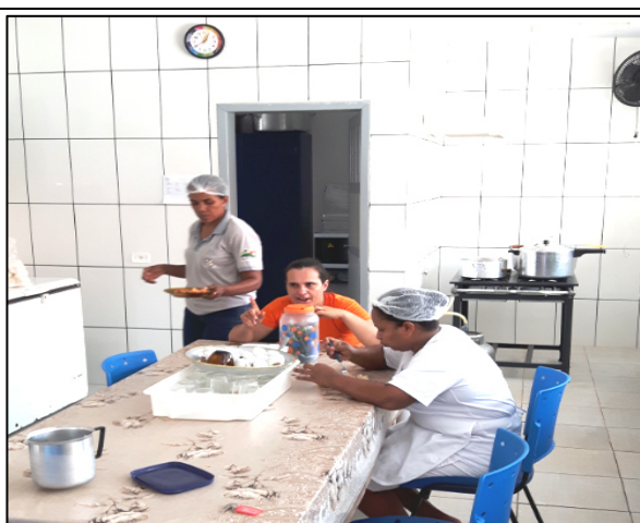
Foto 24 – (Escola Maria Quitéria – Assentamento São Pedro). Servidores do apoio a limpeza e merendeira almoçando da merenda escolar separadamente na cozinha. Resolução 26/2013 - PNAE, Art. 3º. Paranaíta/MT, 28/09/2016. Paranaíta/MT, 28/09/2016.

Foto Inferior – Escola Juscelino K. de Oliveira. Servidor na fila da merenda, foto tirada em 28/09/2016. Resolução 26/2013 - PNAE, Art. 3º. Paranaíta/MT, 28/09/2016.