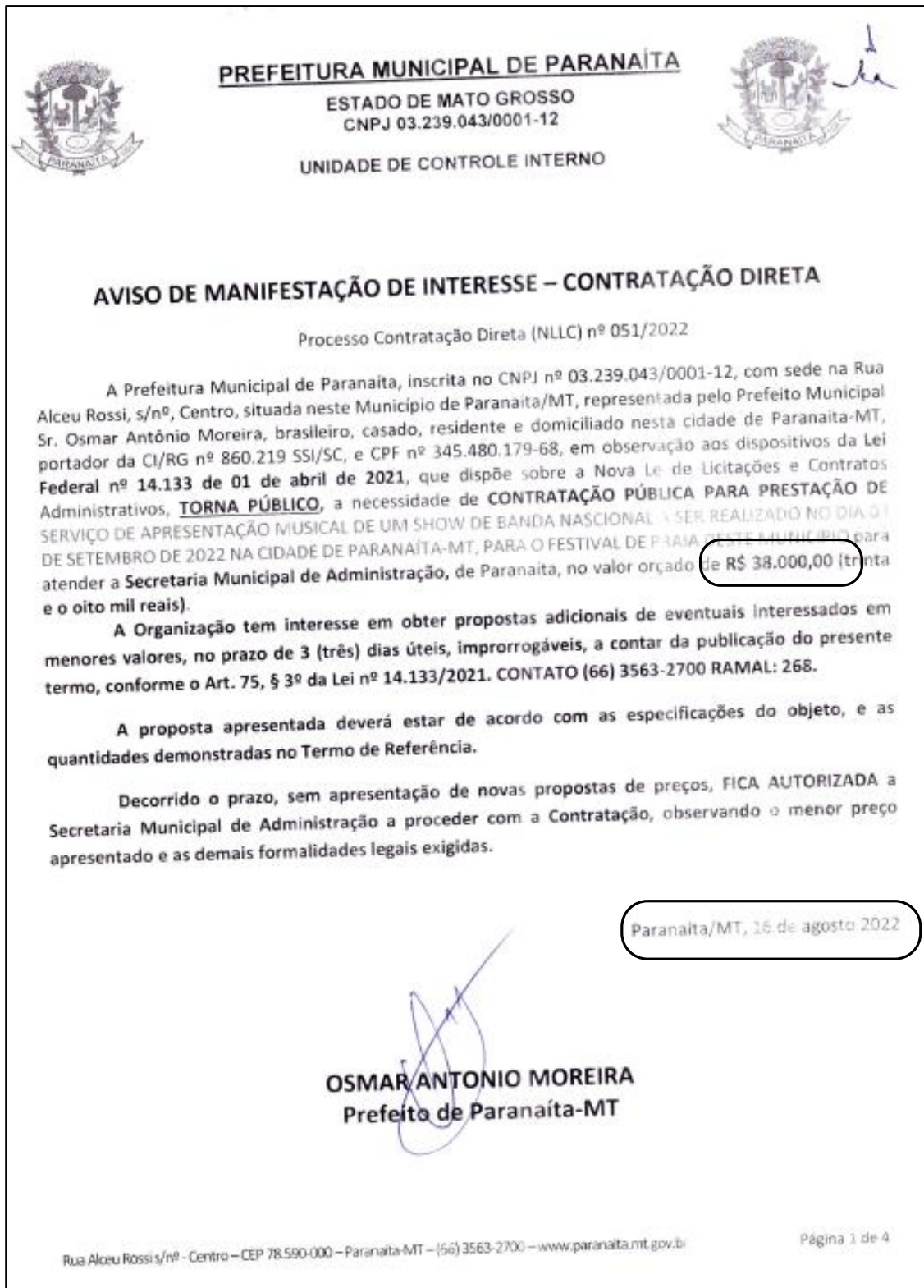
Imagem 01: A mesma manifestação de Interesse de 16/08/22, com valor menor apurado de R$ 38.000,00 usada em todas as publicações, no entanto, na segunda publicação os demais documentos foram retirados do site.